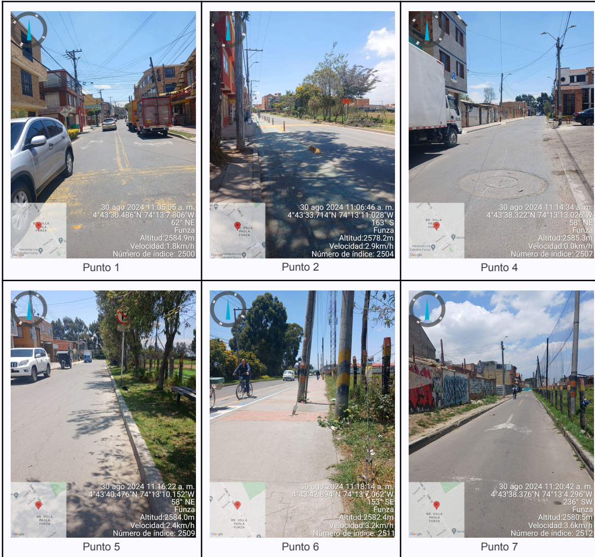
Ilustración 3. Fotos de los puntos del Recorrido de Control Y Vigilancia.